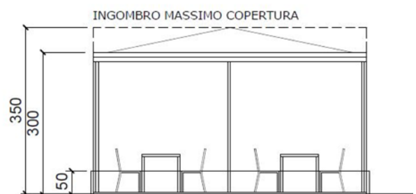
B. Schema Dehor

5. Per gli ambiti di Vicolo Amilcare Airoldi, Via del Pozzo, Vicolo Giacomo Anghileri, Via del Torchio, Via Canonica, Vicolo Granai, ed ulteriori vie e vicoli limitrofi alla Piazza XX Settembre e Piazza Mario Cermenati , data la particolare conformazione urbanistica dello spazio pubblico, l'occupazione con strutture di arredo a carattere temporaneo potrà solo riguardare tavoli, sedie, ombrelloni, tende ombra sole, nonché oggetti per il confort ambientale quali impianti di riscaldamento ad irradiazione, assicurando in ogni caso l'utilizzo pedonale degli