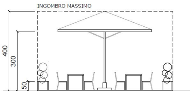
A. Schema strutture di arredo

A titolo esemplificativo si riportano i seguenti schemi relativi alle differenti tipologie di occupazione di suolo, tramite semplici strutture di arredo (schema A) ovvero tramite dehors (schema B) per l'ambito di Piazza XX Settembre e Piazza Mario Cermenati: